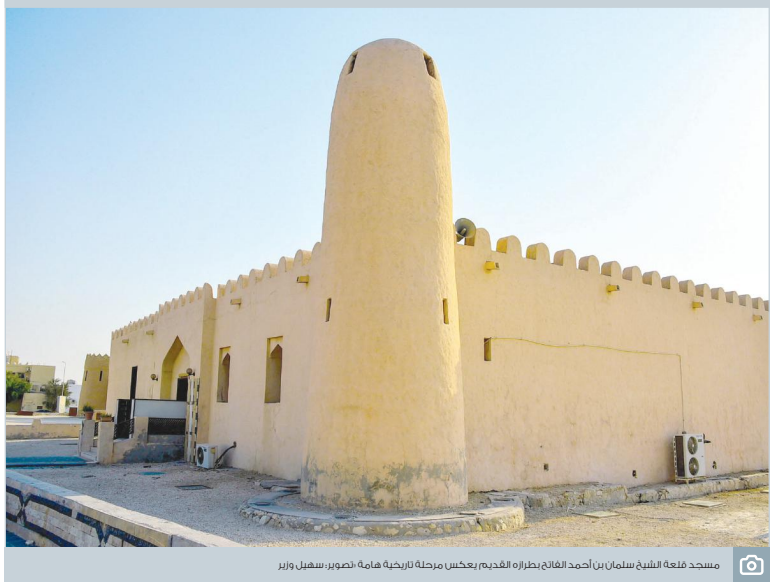
مسجد لعة الشيخ سلمان بن أحمد الخاليفي بعمارة الفخيم يعكس مرحلة النهضة هامة، تصوير: سهيل وزير