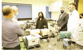
زيارة وزارة التعليم العالي