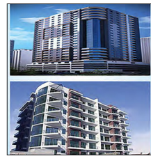
مشروعاً «مارينا ريف» و«دار العز»

أعلن القاضي صلاح أحمد القطان رئيس لجنة تسوية مشاريع التطوير العقارية المتعثرة أن اللجنة أصدرت قرارات في مشروعين من المشاريع المتطورة أمامها. وبين بيان اللجنة أصدرت قراراتها، في المشروعين وهما مشروع مارينا ريف ومشروع دار العز 2 و3، وذلك بعد دراسة الأوراق المقدمة إليها من المشتريين والدائنين وبعد انتخاب الخبراء الفنيين والمحاسبين. وتوه رئيس اللجنة أنه بالنسبة لمشروع مارينا ويست وتلال الغروب والمشروعات الأخرى، فإن اللجنة قد قطعت شوطاً كبيراً لإنجاز كل المقترحات الإيجابية بشأنها للتوصل إلى حلول جذرية، وأنه يجري خلال الفترة الوجيهة القادمة الإعلان عما توصلت إليه اللجنة من حلول بشأنها. 04