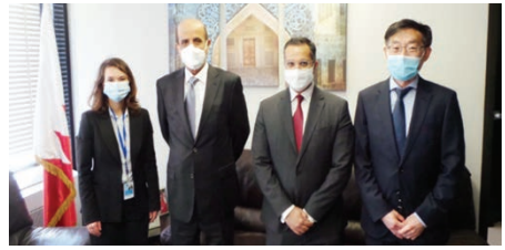
وزير التربية والتعليم خلال لقاء المسؤولين - جائزة اليونسكو - الملك حمد بن عيسى آل خليفة.

وهو ما انعكس على القطاعات الأخرى كقطاع الإنشاءات والمقاولات والعقارات وقطاع التجارة والحركة المصرفية وغيرها من قطاعات ساهم «مزايا»، في انتعاشها. وبيّنت وزارة الإسكان أن نسبة شراء الوحدات السكنية مقارنة بالمشروع في محافظة الشمالية تبلغ ٣٨٪ مقارنة بما نسبته ٢١٪ لتسحق الملكية بدأت المحافظة، وشكلت محافظة المحرق من نسبته ٢٠٪ لتلحق بمقابل ٢١٪ لتلحق فيما كانت نسبة شراء البيوت في محافظة العاصمة ١٠٪، والمحافظة الجنوبية ٢٤٪ لتلحق بمقابل ٧٧٪ لتلحق في محافظة العاصمة ١٠٪، وتأتي برنامج «مزايا» ضمن مبادرات وزارة الإسكان لتبليغ متطلبات برنامج الإسكان للمواطنين على التسهيل على المواطنين من خلال تعزيز التعاون مع القطاع الخاص، إذ استطاع