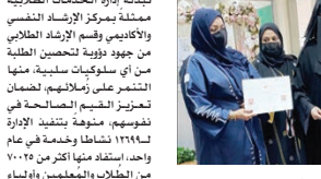
فعالية الاحتفال باليوم الدولي لمكافحة العنف بالمدارس