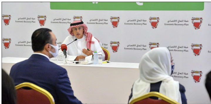
الزياني يعلن عن استراتيجية البحرين السياحية للأعوام القادمة

تمام ابوصافي: أطلق وزير الصناعة والتجارة والسياحة زايد الزياني استراتيجية السياحة 2022-2026 التي تأتي ضمن منظومة استراتيجيات تصب في 27 برنامجاً لخطط التعافي الاقتصادي. وقال الوزير الزياني في مؤتمر صحفي عقده في مركز البحرين للمعارض إن الاستراتيجية ترتكز على خمسة عناصر هي الإشهار والجذب السياحي والتسويق والترويج والإقامة، مشدداً على أن الأهداف الرئيسة للخطط هي إبراز مكانة البحرين كمركز سياحي عالمي، وزيادة مساهمة السياحة في الناتج المحلي، وزيادة عدد الدول المستهدفة، وتنوع المنتج السياحي. تستهدف تحقيق عائد مالي يصل إلى 2 مليار دينار كإجمالي لإفاق السياحة الوافدة في العام 2026، وذلك نسبة مساهمة في الناتج الإجمالي تصل إلى 1.4% للعام ذاته. كما بين أن الاستراتيجية تتطلع إلى زيادة أعداد الزوار القادمين للمملكة إلى 14.1 مليون في العام 2026، وكشف عن تفاصيل تحقيق الاستراتيجية، وذلك عبر تسهيل الدخول عبر تطوير نظام التأشيرات، وتعزيز شبكة النقل الجوي، وتنفيذ مشروع توسعة المطار، والعمل على مرفأ بحري جديد. 06