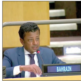
السفير جمال الرويعي

على تطبيق استراتيجية الأمم المتحدة العالمية لمكافحة الإرهاب، وتوصيات مجموعة العمل المالي المعنية بمكافحة غسل الأموال وتمويل الإرهاب (FATF)، كما تطرق إلى خطر استغلال الفضاء السيبراني، خاصة وسائل التواصل الاجتماعي من قبل الجماعات الإرهابية لبلب أفكارها الخبيثة أو التجنيد أو شن هجمات إلكترونية تستهدف مكاتبات الدول والشعوب، مشيراً في هذا الصدد إلى مشاركة ملكة البحرين في المؤتمر رفيع المستوى الثاني لرؤساء هيئات مكافحة الإرهاب والجهات المعنية بمكافحة الإرهاب بعنوان «مكافحة الإرهاب ومنعه في عصر التقنيات التحولية» (مواجهة تحديات العقد الجديد)، الذي عقد في يونيو 2021، بتنظيم من مكتب الأمم المتحدة لمكافحة الإرهاب، إذ هدف المؤتمر إلى بحث فرص تعزيز التعاون الدولي وتبادل المعلومات لمكافحة استخدام الإنترنت في الأغراض الإرهابية، وتبادل الممارسات الفضلى بشأن مكافحة الرسائل الإرهابية، ومنع التضليل وسوء استغلال التقنيات الجديدة.