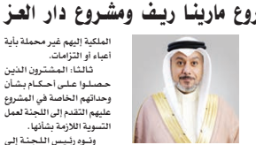
القاضي صلاح القطان